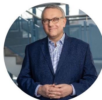
Präsident Götz Ulrich

Deutschland steht im Investitionsstau. Straßen, Brücken, Schulen, öffentlicher Schienen- und Personennahverkehr, IT-Infrastruktur, Digitalisierung sowie Katastrophen- und Bevölkerungsschutz – überall zeigt sich, dass Investitionen in den letzten Jahren und Jahrzehnten aus Kostengründen verschoben wurden.